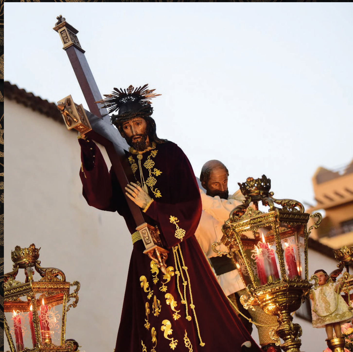
fotografía: El Nazareno y Simón de Cirene - Parroquia Nuestra Señora de la Peña de Francia