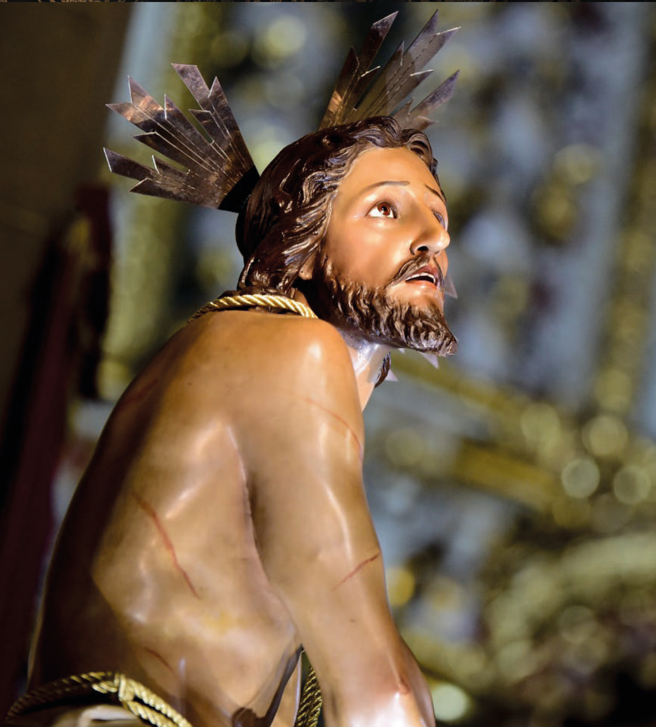
fotografía: Cristo de la Columna - Parroquia Nuestra Señora de la Peña de Francia