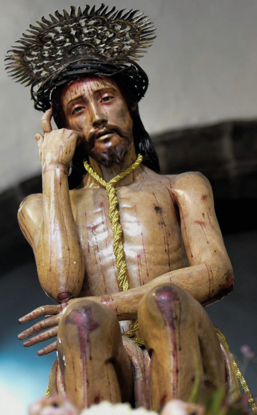
fotografía: Señor de la Humildad y Paciencia - Iglesia de San Francisco