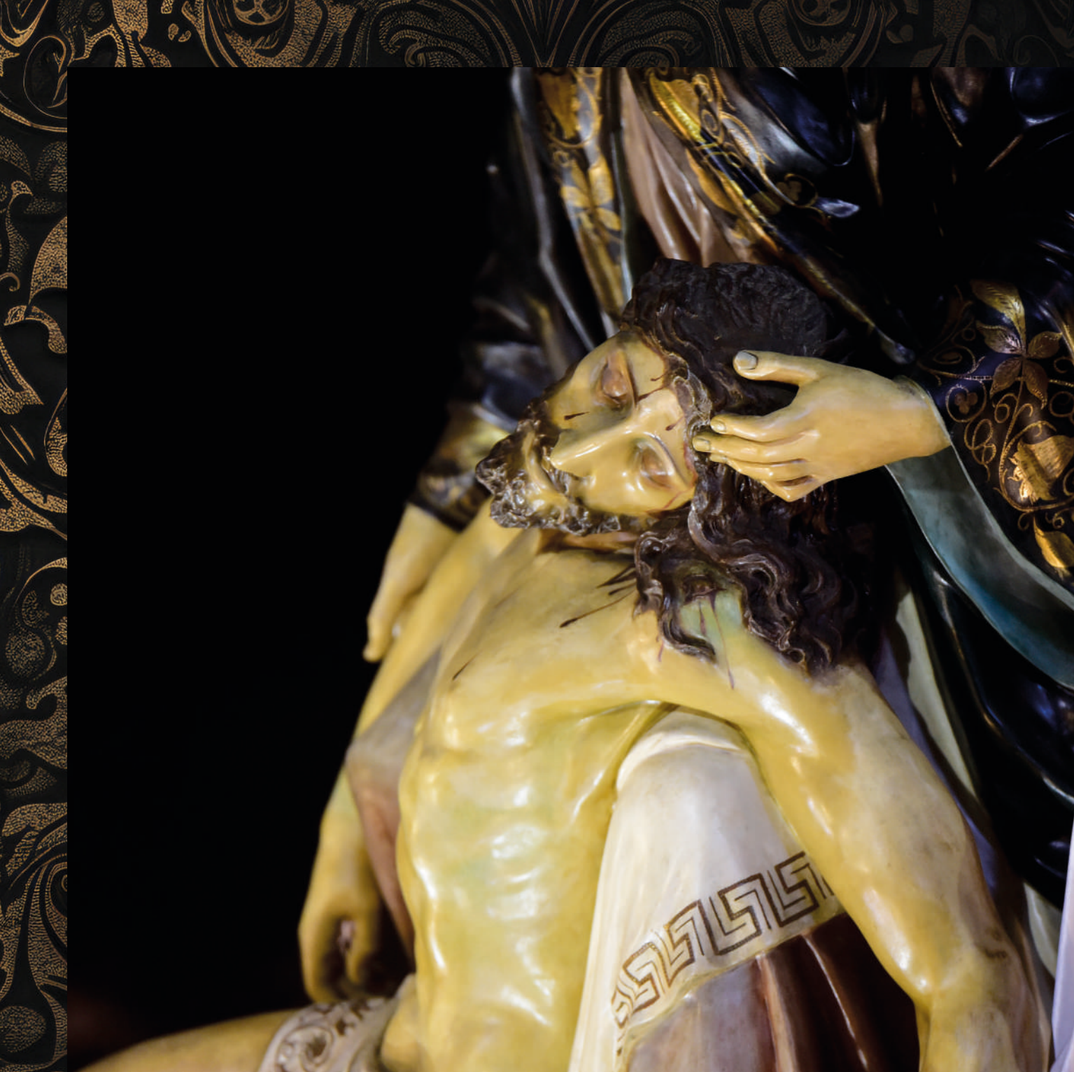
fotografía: Santísimo Cristo del Calvario y Virgen de la Piedad - El Calvario - Parroquia Ntra. Sra. de la Peñita