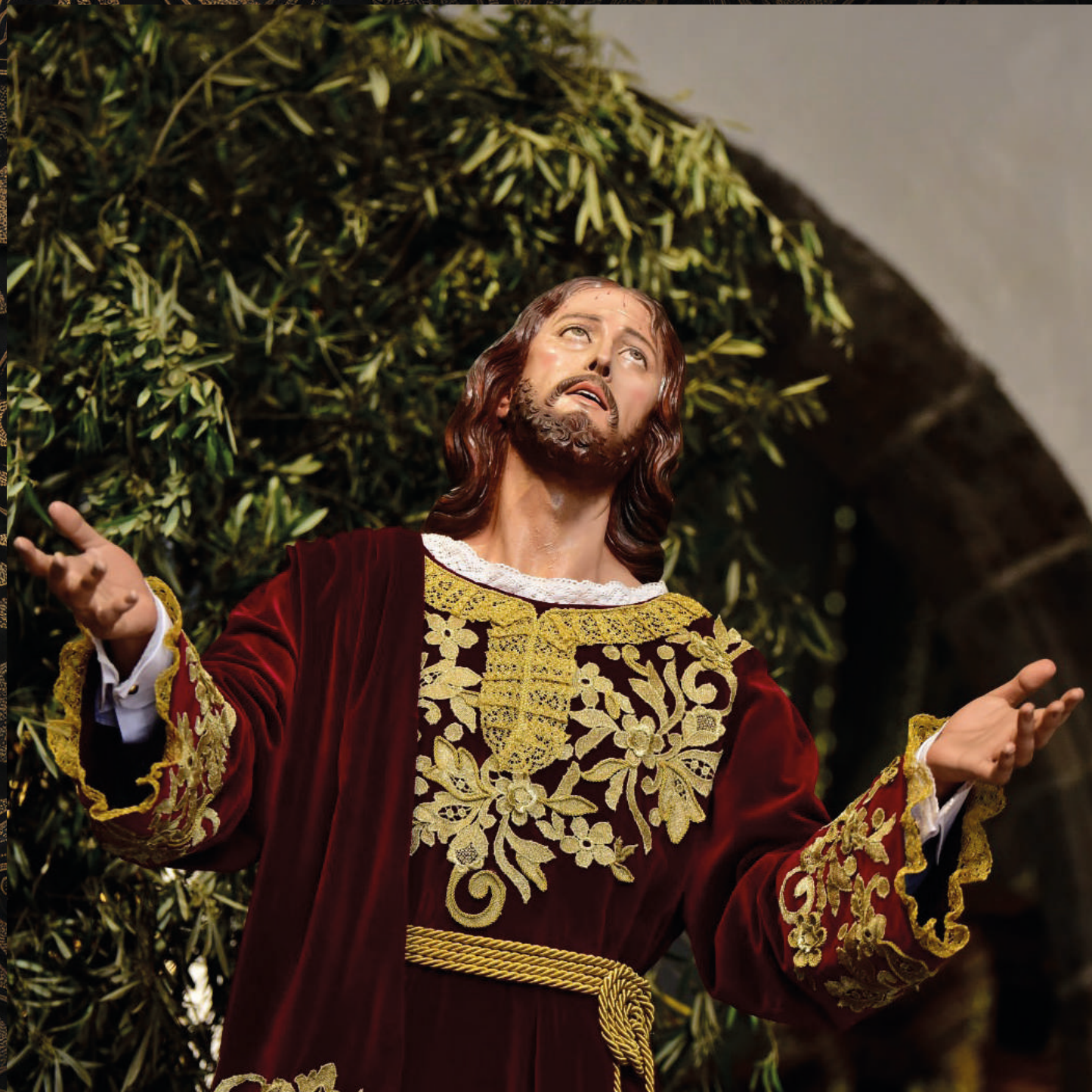
fotografía: Santísimo Cristo del Huerto - Iglesia de San Francisco