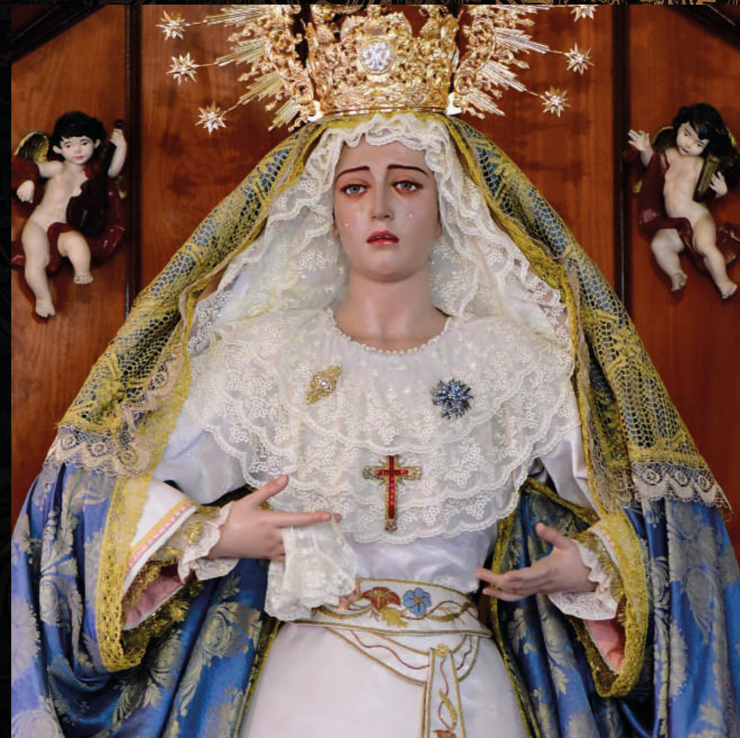
fotografía: Nuestra Señora de los Dolores - Parroquia de Ntra. Sra. de los Dolores y San Felipe Apóstol

Información facilitada por las distintas Parroquias del municipio, cualquier cambio en la programación será anunciada por la Parroquia correspondiente.