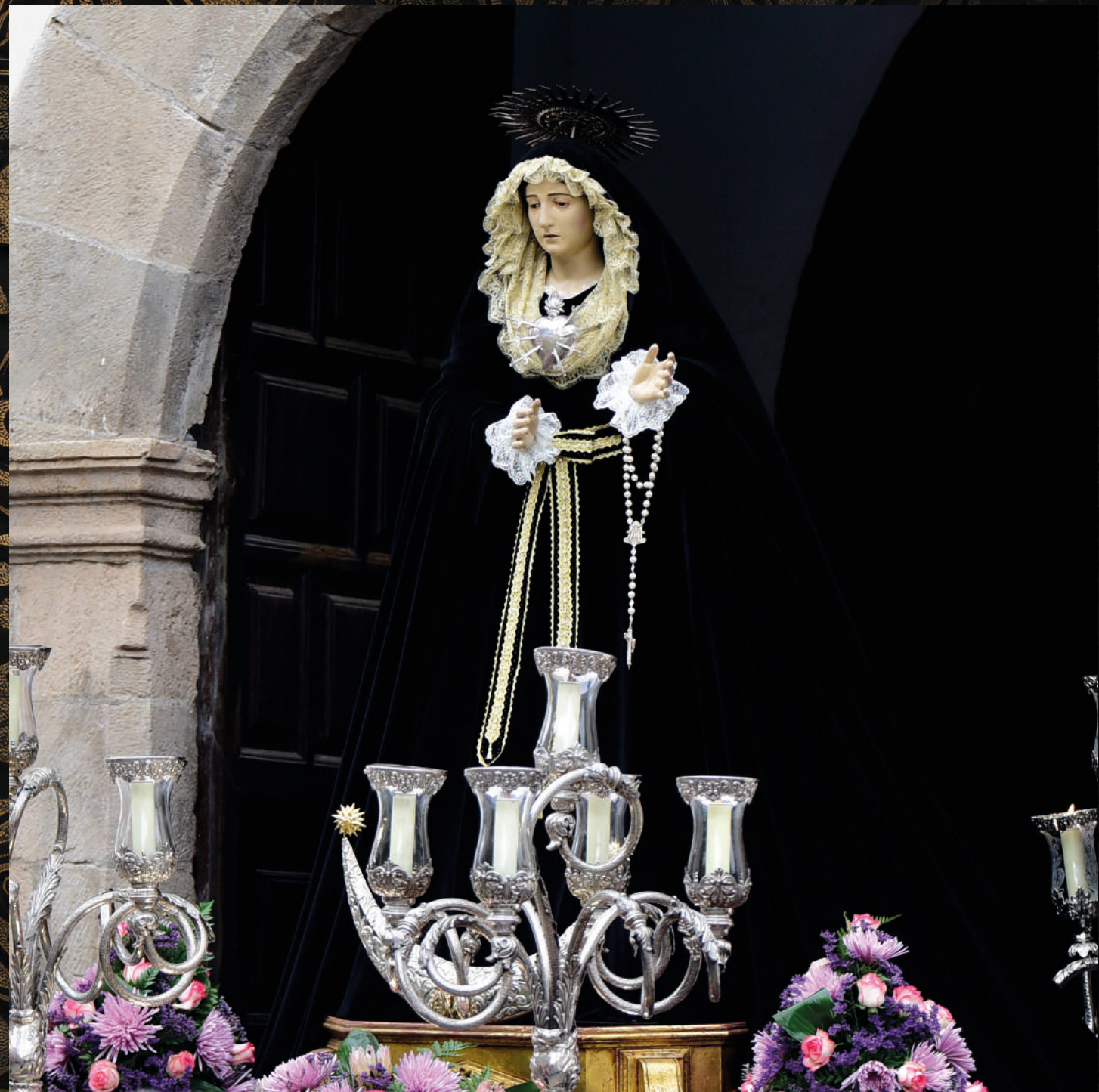
fotografía: Nuestra Señora de los Siete Dolores - Iglesia de San Francisco