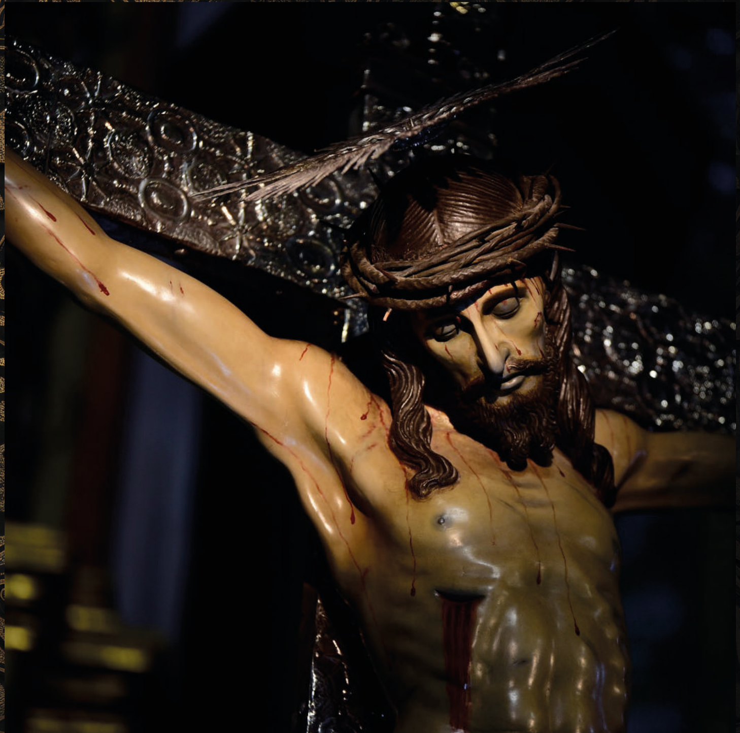
fotografía: Santísimo Cristo de la Salud - Parroquia Nuestra Señora de la Peña de Francia