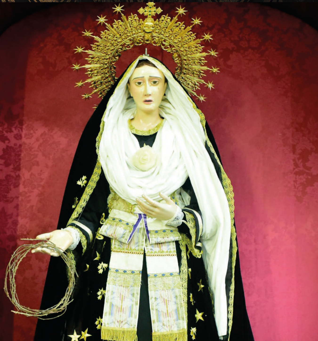
fotografía: Virgen de los Dolores - Parroquia de San Antonio de Padua