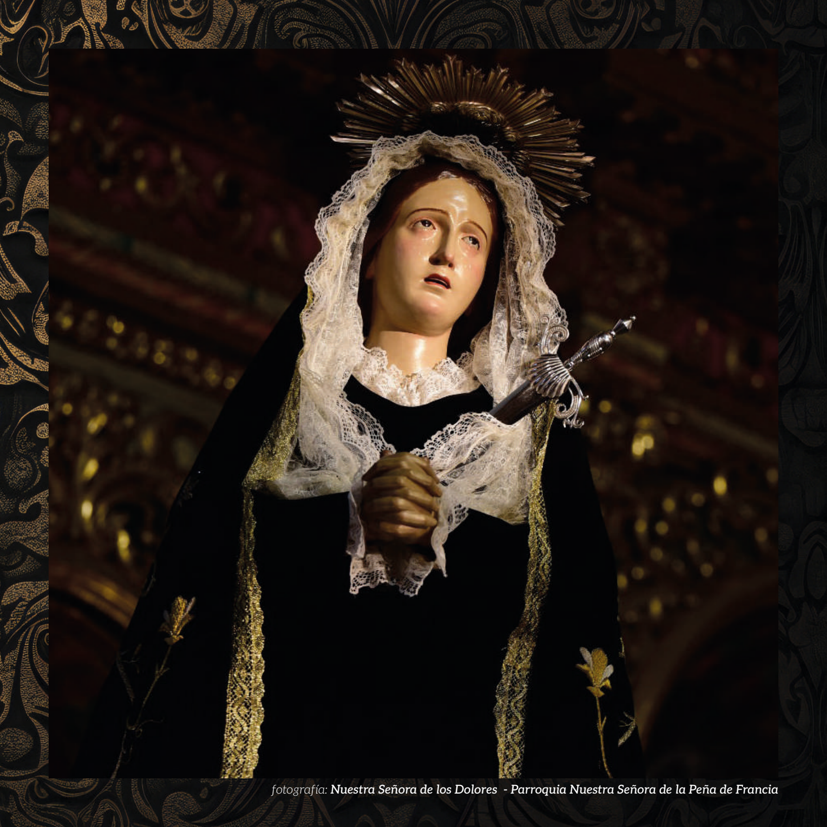
fotografía: Nuestra Señora de los Dolores - Parroquia Nuestra Señora de la Peña de Francia