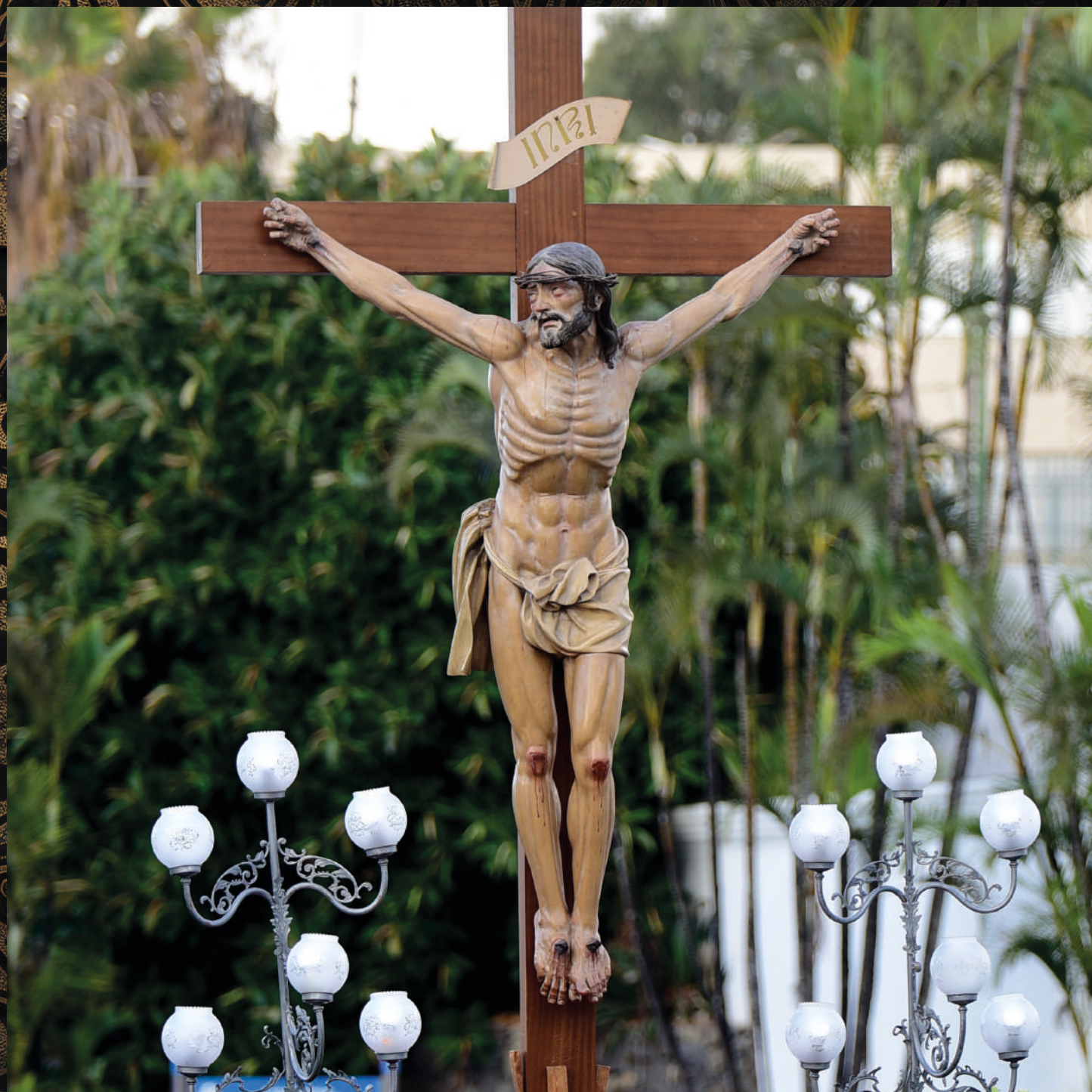
fotografía: Cristo de la Agonía - Parroquia de Santa Rita de Casia