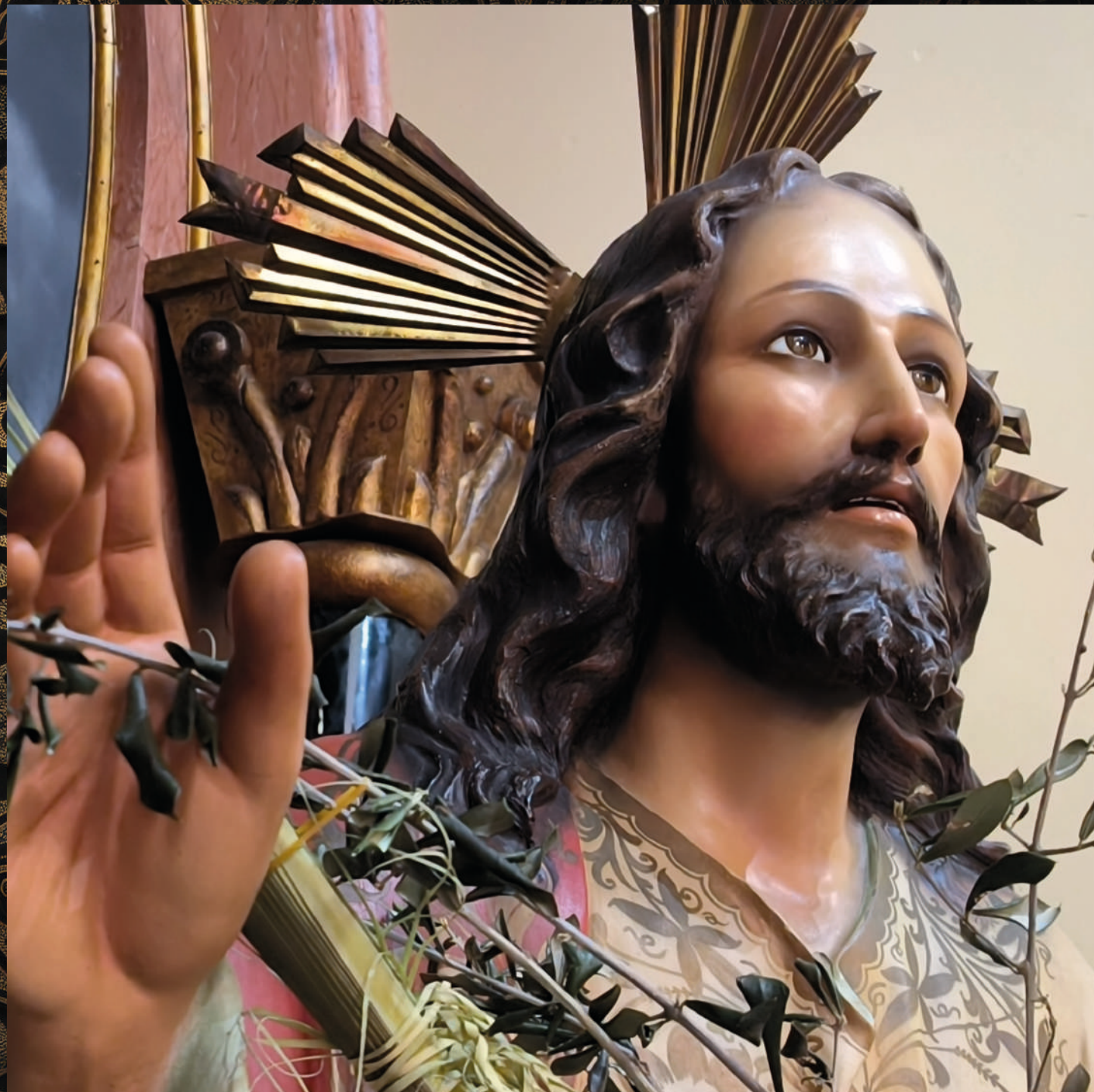
fotografía: Señor de la Burrita - Parroquia Nuestra Señora de Candelaria