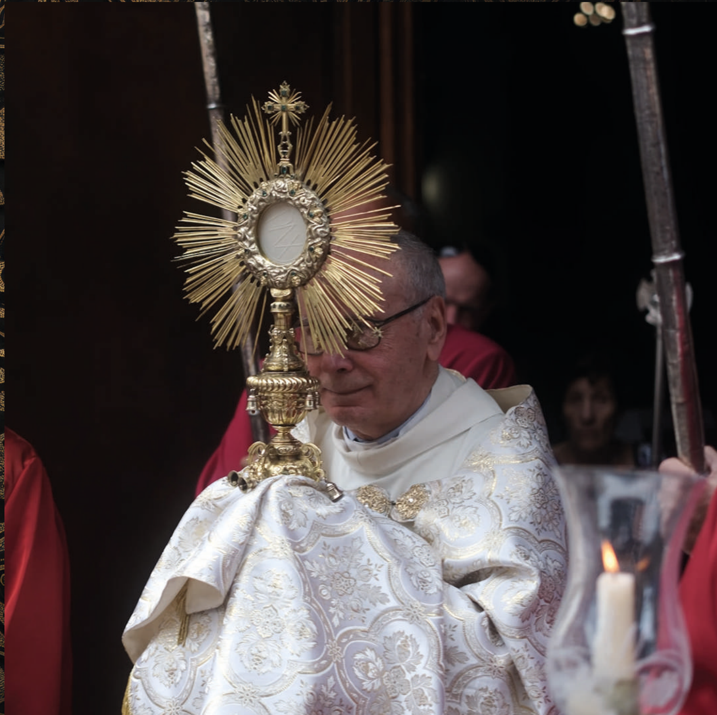
fotografía: Procesión del Santísimo - Parroquia Nuestra Señora de la Peña de Francia