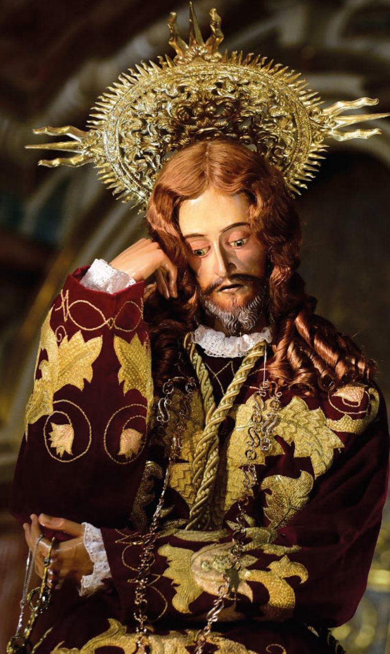
fotografía: Gran Poder de Dios - Parroquia Nuestra Señora de la Peña de Francia